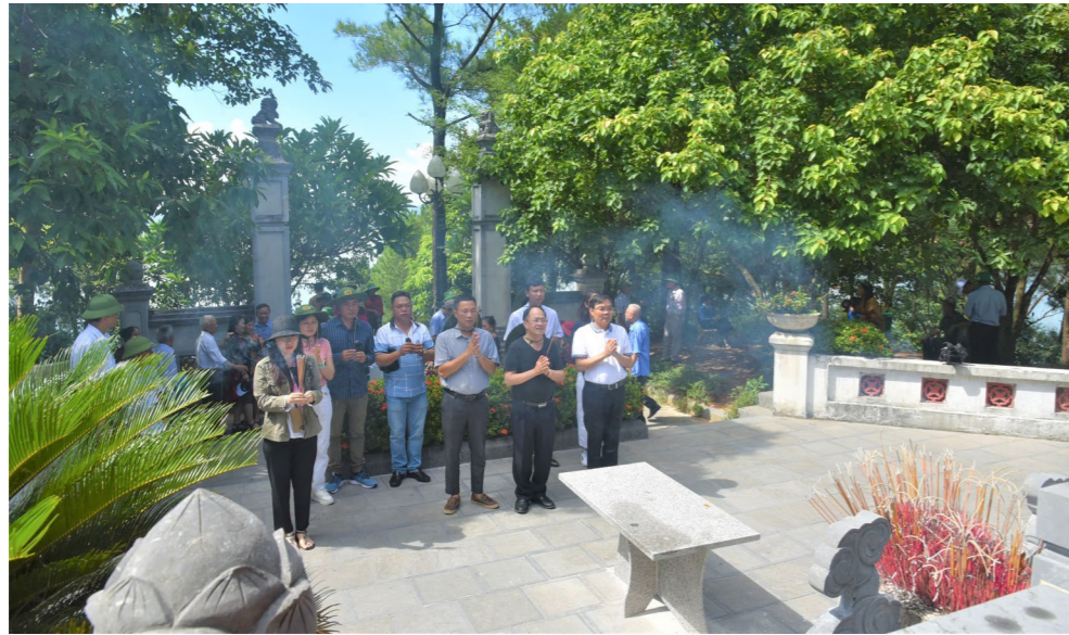
Chuyến tham quan công trình thủy lợi Hồ Kẻ Gỗ và viếng đền thờ Tổng bí thư Lê Duẩn.

năm 1976. Năm 1980 các hạng mục chính mới hoàn thành tuy nhiên phải đến năm 1983, hồ mới chính thức được đưa vào sử dụng. Hồ bao gồm 1 đập chính, 10 đập vụ và có sức chứa hơn 300 triệu mét khối nước.