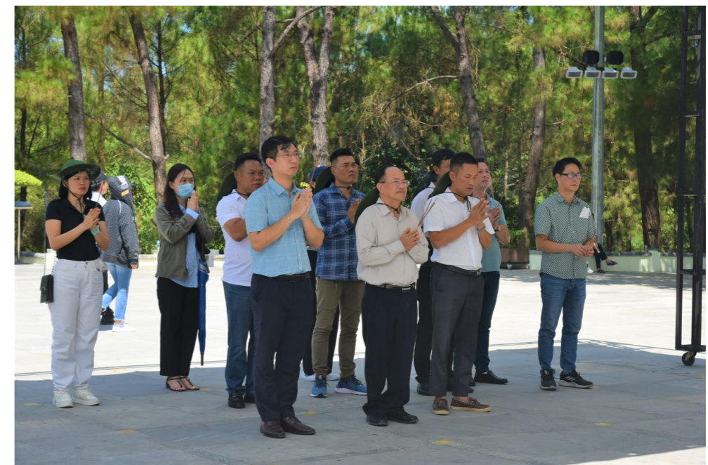
Đoàn thắp hương kính viếng các Anh hùng liệt sỹ.