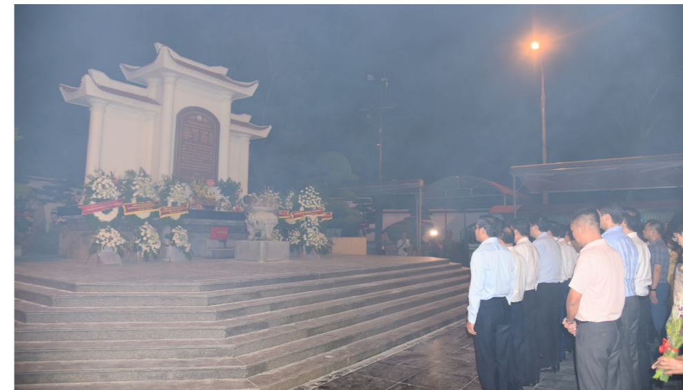
Đoàn công tác, cùng các đại biểu thành kính dâng hoa, dâng hương tại Khu di tích Ngã ba Đồng Lộc

lớn miền Bắc” với “Tiền tuyến lớn miền Nam”. Khu di tích lịch sử này gắn liền với sự hy sinh anh dũng của Tiểu đội 10 cô gái Thanh niên xung phong thuộc Tiểu đội 4, Đại đội 552, Tổng đội 55, 10 cô gái đã hy sinh khi tuổi đời còn rất trẻ.