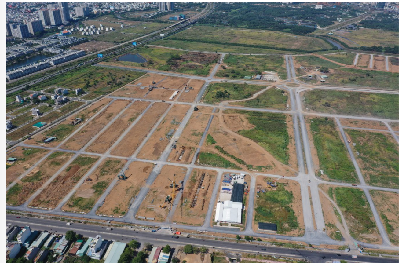
Một dự án chào bán bất động sản liền thổ tại TP Thủ Đức trong quý II.

Các biến động giá được cho là đã bao gồm các chính sách bán hàng kèm theo nhiều ưu đãi, chiết khấu, hỗ trợ lãi suất... được chủ đầu tư tính vào giá thành. Quý vừa qua, thành phố đón 921 căn nhà phố, biệt thự mới và bán được 572 căn. Lượng tiêu thụ trong 6 tháng đầu năm phần lớn thuộc các dự án quy mô lớn.