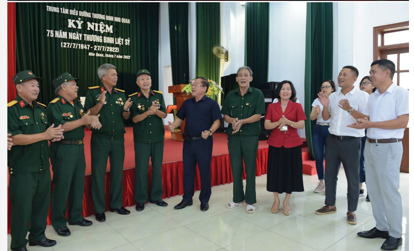
Hoạt động giao lưu văn nghệ như món quà tinh thần cổ vũ các thương bệnh binh

Với phương châm đề cao trách nhiệm xã hội, Him Lam Land luôn chú trọng tham gia các chương trình thiện nguyện mang ý nghĩa nhân văn cao cả, đóng góp vào sự phát triển chung của cộng đồng. Hoạt động thăm hỏi, tặng quà các trung tâm điều dưỡng thương binh là một trong số