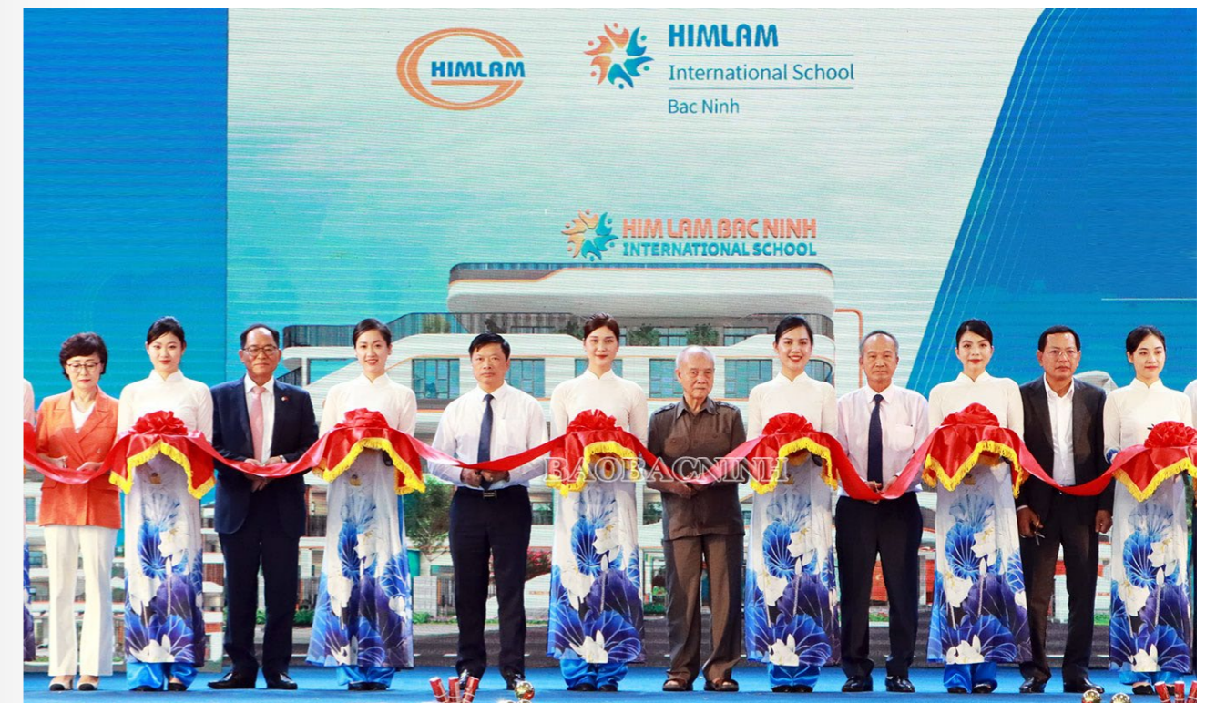
Các đại biểu cắt băng khánh thành Trường Quốc tế Him Lam

lập năm 2021 được xây dựng trong khuôn viên khu đô thị Him Lam Green Park (Thành phố Bắc Ninh), với 2,2ha, có không gian học tập, cơ sở hạ tầng hiện đại. Trường được chia thành ba phân khu chính, gồm: 60 phòng học, 50 phòng chức năng và thực hành, nhà thi đấu rộng 2.800 m2, 2 bể bơi bốn mùa; khối thư viện, phòng âm nhạc, và sân chơi được thiết kế riêng biệt cho khối Mầm non và Trung học, phù hợp với đặc thù của mỗi nhóm tuổi.