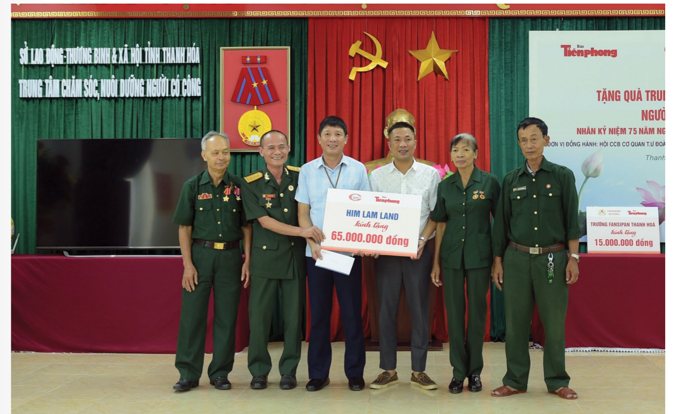
Đại diện Him Lam Land thăm hỏi và tặng quà tại Trung tâm điều dưỡng thương binh Thanh Hóa

Trung tâm điều dưỡng thương binh trên địa bàn các tỉnh Thanh Hóa, Ninh Bình, Hà Nam, Nghệ An... với tổng số tiền lên tới hơn 300 triệu đồng.