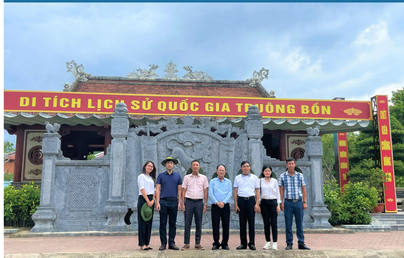
Đoàn công tác về tham quan và dâng hương tại Khu di tích lịch sử Trương Bồn (tỉnh Nghệ An).

Khu di tích lịch sử Truong Bồn - “Địa chỉ đỏ” chứng tích một trong những huyền thoại về cuộc chiến tranh vệ quốc vĩ đại của dân tộc ta trong thế kỷ 20. Truong Bồn là một địa danh thuộc xã Mỹ Sơn, huyện Đô Lương, tỉnh Nghệ An, nằm trên tuyến đường chiến lược 15A trong kháng chiến chống Mỹ. Nơi đây được ví như “tọa độ lửa” có vị trí chiến lược đặc biệt quan trọng trong cuộc đấu tranh giải phóng miền Nam.