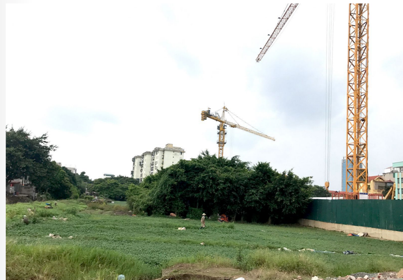
Để thị trường bất động sản sáu tháng cuối năm phát triển mạnh cần đẩy nhanh tiến độ các dự án

Một là, tình hình chung là các dự án bất động sản lớn không tăng. Hai là, không có nguồn vốn đột biến. Ba là, bất động sản du lịch có chuyển biến nhưng không như kỳ vọng do nhiều sản phẩm mới được đưa vào tham gia thị trường và trên nhiều địa bàn mới. Bốn là, bất động sản công nghiệp không có đột biến do đang có điều chỉnh trên thị trường thế giới do cấm vận đối với Nga. Đồng thời Mỹ và Tây Âu đang tập trung vốn tạo đối trọng với Trung Quốc. Năm là, bất động sản nhà ở vẫn tiếp tục có giao dịch trên phân mảng nhà chung cư, trong khi đó, các nhóm nhà ở cao cấp không tiếp tục tăng nữa, thậm chí có xu hướng giảm. Sáu là, bất động sản đất nền khu vực mới đô thị hóa vẫn phát triển ổn định, tuy nhiên, không mạnh mẽ như đầu năm 2021-2022.